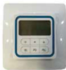
Mando 15 canales Mando 1- 5 canales TIMER

*TIMER, mando a distancia con posibilidad de programación horaria.